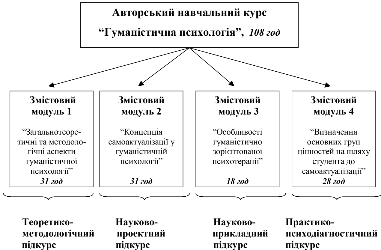
Рис. 1. Модульно-змістова структура авторського курсу

Крім того, нами розроблена та апробована граф-схема навчального курсу “Гуманістична психологія”, що дає змогу долати традиційний дисбаланс між освітньо-академічними і буттєво-особистісними інтересами студентів, залучати їх до наукового проектування і психодіагностичного практикування ( рис. 2 ). Граф-схема побудована на основі авторських концептуальних положень (див. Фурман А.В. Модульно-розвивальне навчання: принципи, умови, забезпечення: Монографія. – К.: Правда Ярославичів, 1997. – 340 с. ), а саме: