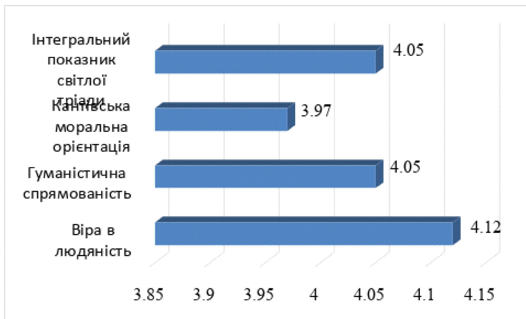
Рис. 1. Середні значення компонентів «світлої тріади» у досліджуваній вибірці здобувачів-психологів (вбірка – 75 осіб)

повідальну форму ставлення до іншого. У будь-якому разі емпатія є інтегративним механізмом забезпечення переходу від внутрішніх морально-ціннісних диспозицій до їх конкретної поведінкової реалізації, опосередковуючи формування довірливих, етично виважених і психологічно безпечних, форм міжособистісного контактування.