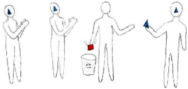
Рис. 3. Радісний день у сім'ї

На цьому малюнку студентка психологічного факультету зобразила, як батьки ініціюють підміну її потреб і цінностей власними, а родичі це заохочують оплесками. І це поряд люди (батьки, родичі) з вищою освітою. Хіба це не змушує задуматися про силу прагматичних тенденцій? Саме вони й потрапляють в актив діагностико-корекційного процесу. Що ж стосується первісних людей, то вони не потребували корекції, оскільки в них уявлення були ще недиференційованими.