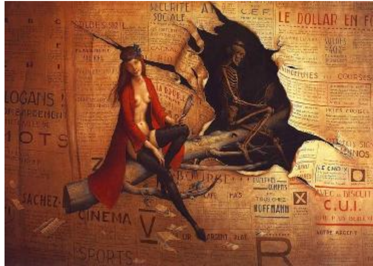
Рис. 5. К. Верлінде — La Decbirure

Н.: Ні, не можу, це важко, особливо важко звернутись до дівчини... Скелет – це усталений в душі залишок моїх страждань із дитинства.