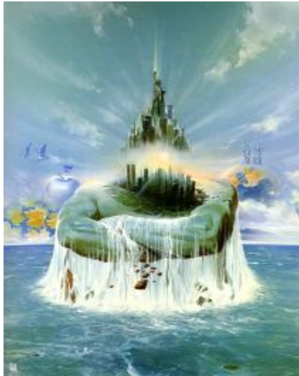
Рис. 4. Войтек Сюдмак — Найсильніший