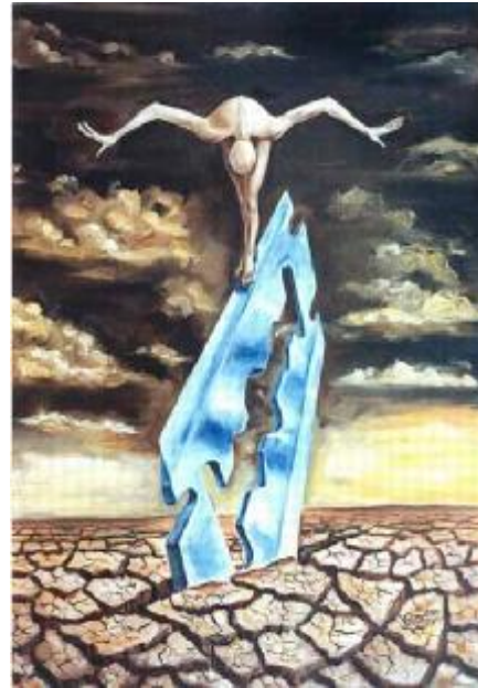
Рис. 8 В. Гожев — Сьогодні

дуалізовано, що оприявнюється у процесі взаємодії в системі “психолог – респондент”.