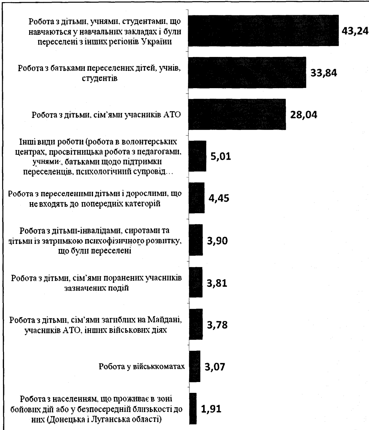
Рис. 1. Кількість працівників психологічної служби, які надають допомогу постраждалим унаслідок окупації Криму і Севастополя та бойових дій на Сході України (% від загальної чисельності)

діти-сироти і діти, котрі мають вади психофізичного розвитку, які були переселені; діти і дорослі, що не відвідують даний навчальний заклад; призовники і резервісти.