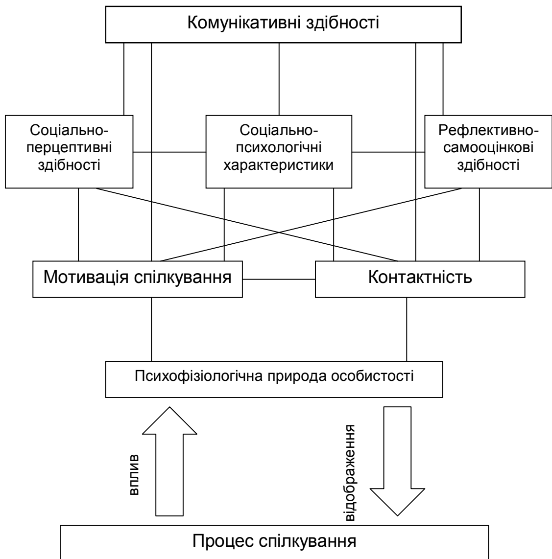
Рис. 1. Структура КП особистості студента

спільної предметної діяльності тісно взаємопов'язані. Рівень психологічного розвитку групи тим вищий, чим повніше і глибше всі міжособистісні взаємини в ній опосередковані суспільно цінним та особистісно значущим змістом спільної роботи [16]. Крім того, взаємозв'язок комунікативного потенціалу особистості як конкретного учасника спілкування і