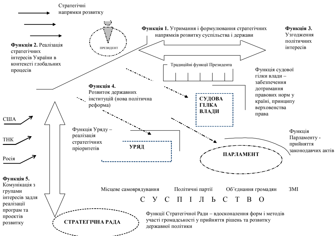
Рис 2. Нові функції президента

Результати – аналітична записка, що містить огляд ситуації в суспільстві у контексті реформи державного управління, інвентаризацію наявних та бажаних спроможностей інституту президента у здійсненні політичної реформи, оцінки діяльності уряду щодо стратегічних напрямків розвитку суспільства, а також пропозиції щодо організації консультативного процесу у зв’язку з попередніми оцінками та аналізом ситуації.