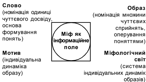
Рис. 3. Четверинна мислесхема інформаційного виміру міфу

В інформаційному плані міфологічну наратію можна аналітично розкласти на три базові одиниці: слово, образ, мотив . Подальше переплетення, взаємопроникнення міфологем, взаємне задіяння мотивів, образів, ключових слів творить міфологічний світ , котрий є, як було сказано вище, універсальним в основних моментах та індивідуальним у деталях та аранжуванні.