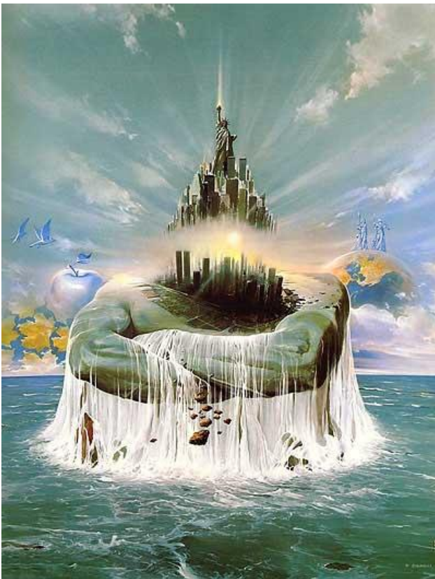
Рис. 2. Картина В. Сюдмака “Найсильніший”

П: Наступний малюнок – це репродукція “Найсильніший” (рис. 2). Коли я дивлюсь на цей малюнок, то в мене виникають відчуття, що це неначе акт самонародження. Чи є в тебе бажання самонародитись? Скинути той хрест, що несеш (рис. 1), відчуття полегшення?!