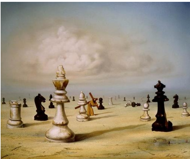
Рис. 1. Картина З. Задемака

П: Вибери ті малюнки, які будуть для тебе емоційно небайдужими. Розклади, будь ласка, їх один за одним за їх значущістю для тебе. Вибери малюнок, з якого будемо розпочинати роботу. (До залу): ми спіраємося на те, що психіка людини знає все, але свідомому ці знання недоступні. Потрібно працювати, щоб ці знання стали надбанням свідомості й допомогли в її особистісному зростанні. Приступаємо до обговорення малюнку. Розкажи, що ти бачиш на рис. 1 .