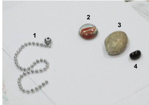
Рис. 6 Я, мама і почуття провини (фото)

Психолог запропонувала зробити модель із каменів (див. рис. 6), де б фігурувала провина.