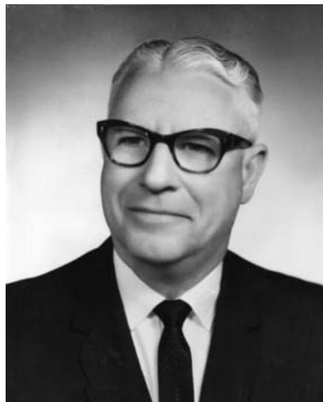
ФІЛІП ЛЕРШ (1898–1972)

Наукове значення цього тексту полягає в тому, що тут подається і конкретизується незвичний (принаймні, для свого часу) підхід до періодизації пси-