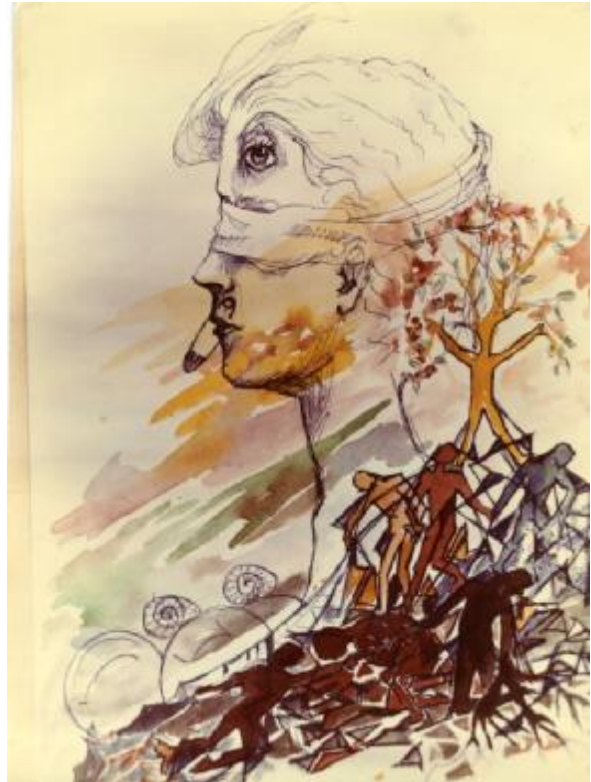
Рис. 2. Психомалюнок іншого учасника групи АСПП

П.: Треба розуміти, що те, що було, вже минуло. Наш світ так влаштований, що є незворотність. Але чому така “зворотність” притаманна психіці, що травма живе вічно? Чому в нас так оживає мортідо, наче це було вчора? Бо є така складова в нашій психіці, як фіксація, сліди – залишкова енергія певних подій. Такі слідові ефекти дуже сильні, тому що вони фіксовані, і треба мати велику мужність і компетентність, щоб це знейтралізувати. Такі сліди несуть погану службу, постійно оживаючи в житті. Ця позиція задає такий елемент повсякдення, що “я не лише живу, я ніби граюся з цим життям, адже раніше мені “там” було не до ігор, бо хтось занурював мене у “психологічну смерть”: прийшов до школи вчитися, а виявилось, що весь у полоні сліз (деструкцій)”. Важливо, якими є ми самі для себе вже в подальшому житті. Щоб не було такого, що вчительки давно вже немає, а ти продов-