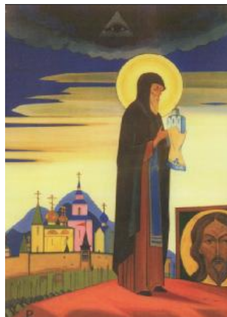
Рис. 8. М. Періх. Святий Сергій Радонезький

велика кількість енергії. Коли я приходжу додому, то постійно відчуваю себе виснаженим. У соціумі я займаюся тим, що стримую себе, роблю із себе наче неживого для того, щоб там бути в оптимумі поведінки.