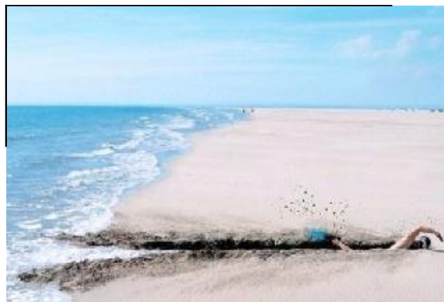
Рис. 3. Автор і назва невідомі

П.: Пов’язка на очах (рис. 2) була прийнята тобою як реальна, тому що так трапилося з мамою: вчителька