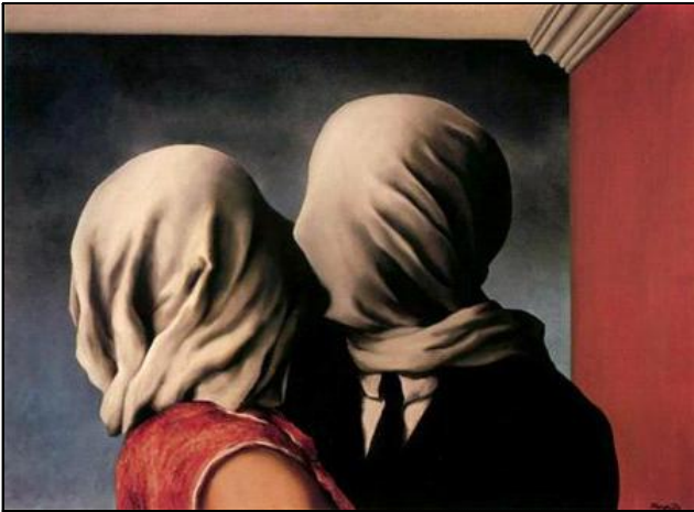
Рис. 5. Р. Магрітт. Закохані