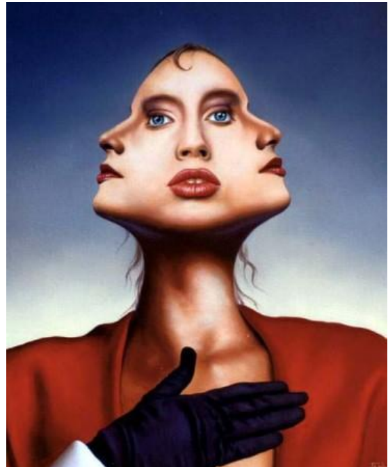
Рис. 4. Дж. Варрен. Ласкаво просимо до Америки. Назва респондента – “Моє тату”

П.: Розумієш, процес – це справді добре, і в нас акцент зроблений на його перебіг, але все-таки процес існує не заради процесу (бо це замкнуте коло), а заради результату. Якщо ми відриваємо одне від одного (процес і результат), то тим самим втрачається сенс. Якщо ми націлені на результат, але не забезпечуємо процес, то його не буде: “Людина, яка йде – подуває дорогу, але за умови обрання правильного напрямку”.