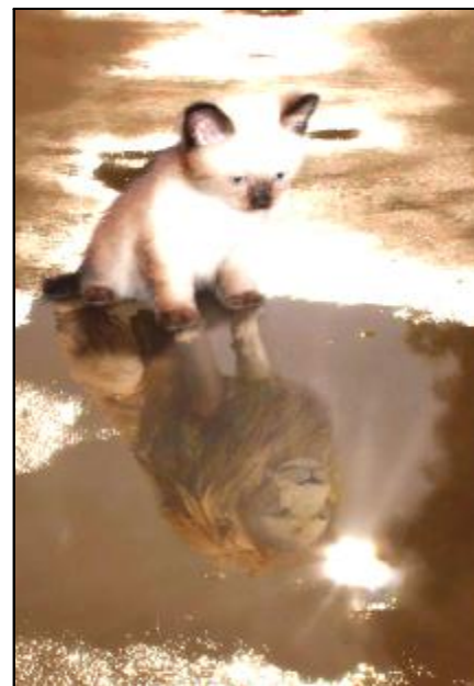
Рис. 6. Автор невідомий. Сміливі мрії про велич

М.: Мене втомлює беземоційність, потреба стримувати себе серед людей, адже на це витрачається