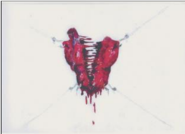
Рис. 1. Тату вини