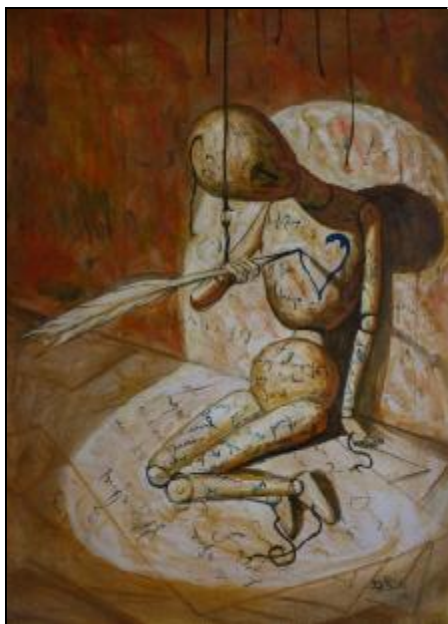
Рис. 7. А. Борда. Назва невідома. Назва респондента – “Моє самооживлення”