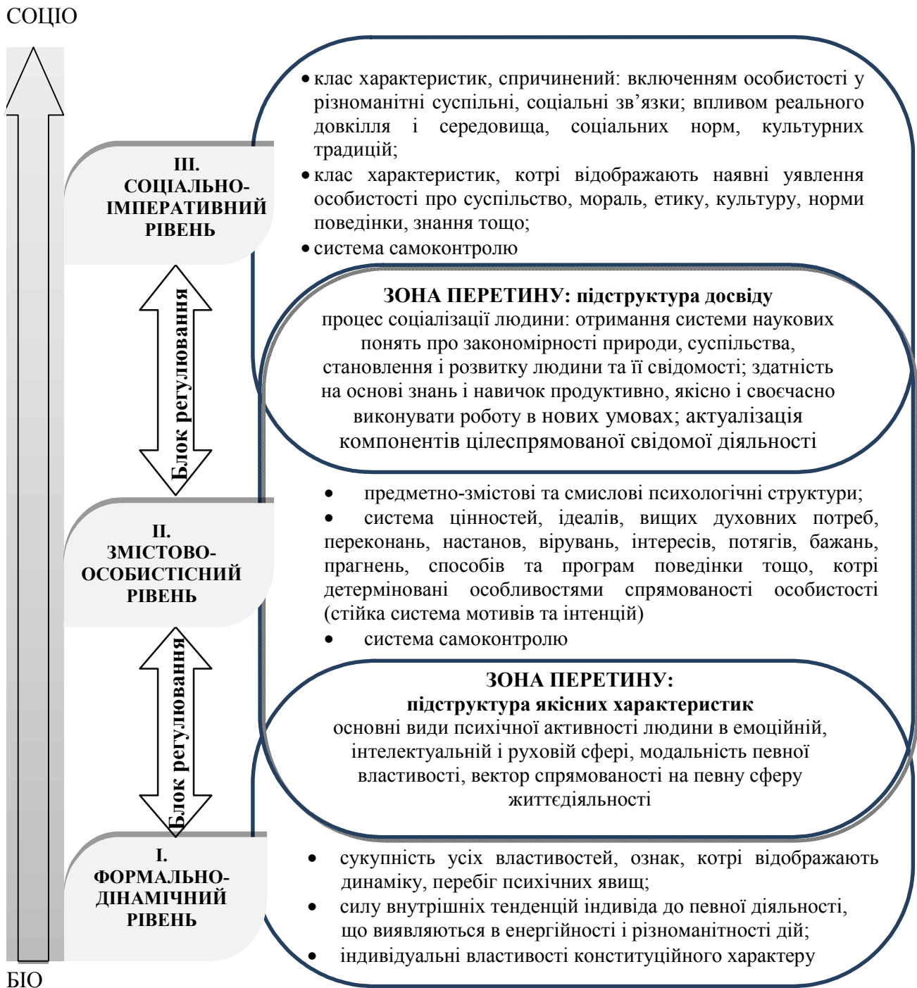
Рис. 1. Континуально-ієрархічна структура особистості